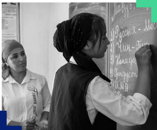
Une élève et son enseignante au tableau à l'école N°30 à Dangara au Tadjikistan.